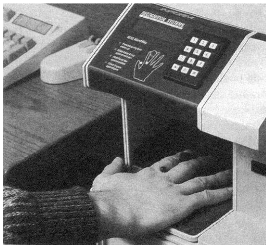
Obr. 2. laserový snímač geometrie ruky v praxi