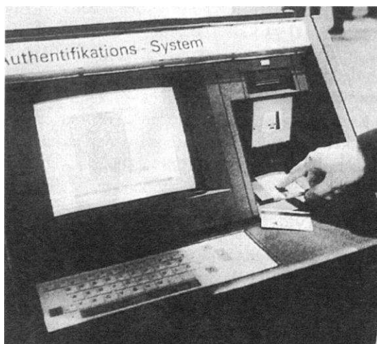
Obr. 1. spoločná identifikácia systémom odtlačkov prstov

Potvrdzuje to realitu, o ktorej sa Biblia zmieňuje už dávno: Keď falošný prorok zvedie ľudí až po tú hranicu, že jedného dňa prijmú znamenie apokalyptického univerzálneho vládcu, Antikrista, tak ho prijmú výlučne na pravú ruku alebo na čelo (t. j. na hlavu !, Zj 13, 16). Vývoj technológií posledných dní sa ubera práve po línii , ktorá korešponduje s doslovným naplnením predpovedí z biblickej knihy Zjavenia, kapitola 13 ! Čo sa týka tam spomenutého znamenia šelmy, musíme na tomto mieste opäť dôrazne upozorniť, že napriek mnohým špekuláciám dnes nemôžeme uviesť žiadne záchytné body, ktoré by nám pomohli predstaviť si, ako bude toto znamenie napokon vyzerieť. Znamenie šelmy je a zostane výsostným znakom Antikrista , a objaví sa až vtedy, keď bude Antikrist vládnuť - nie predtým ! Znamenie šelmy má aj iný, podstatný význam, ktorý ďaleko prekračuje jeho čisto vonkajšiu funkciu ("kupovať a predávať", Zj 13, 17). Nad tým sa hlbšie zamyslíme v nasledujúcej kapitole.